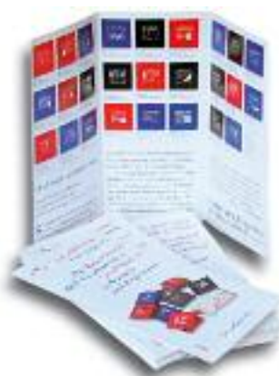
Faltblätter Individueller Adressen- Eindruck möglich