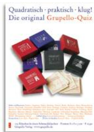
Plakate Format: A3