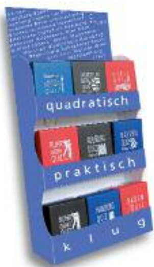
Thekenaufsteller Display für 18 Quizboxen Grundfläche: 26 x 12 cm

Gerne stellen wir Ihnen Werbemittel zur Verfügung. Faltblätter können auf dem Antwortcoupon mit Ihrer Firmenadresse versehen werden. Wenden Sie sich bitte an Richard Keller: keller@grupello.de