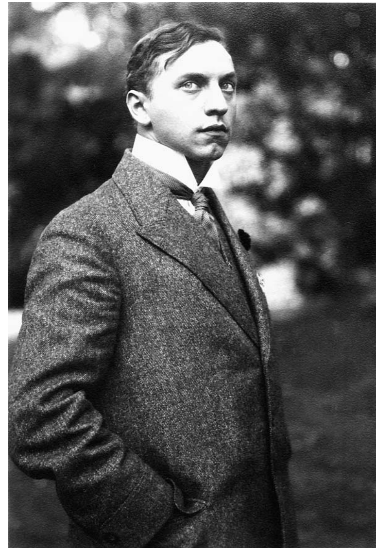
Alfons Paquet, Porträtaufnahme 1903