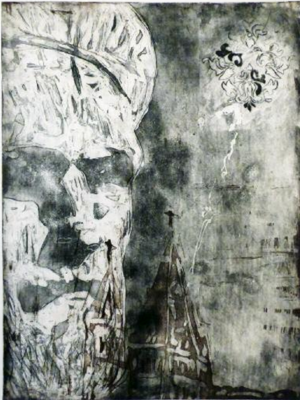
»Gutenbergs Vorahnung« Kaltnadel, Radierung, Aquatinta 80 × 60 cm Auflage: 10 2018