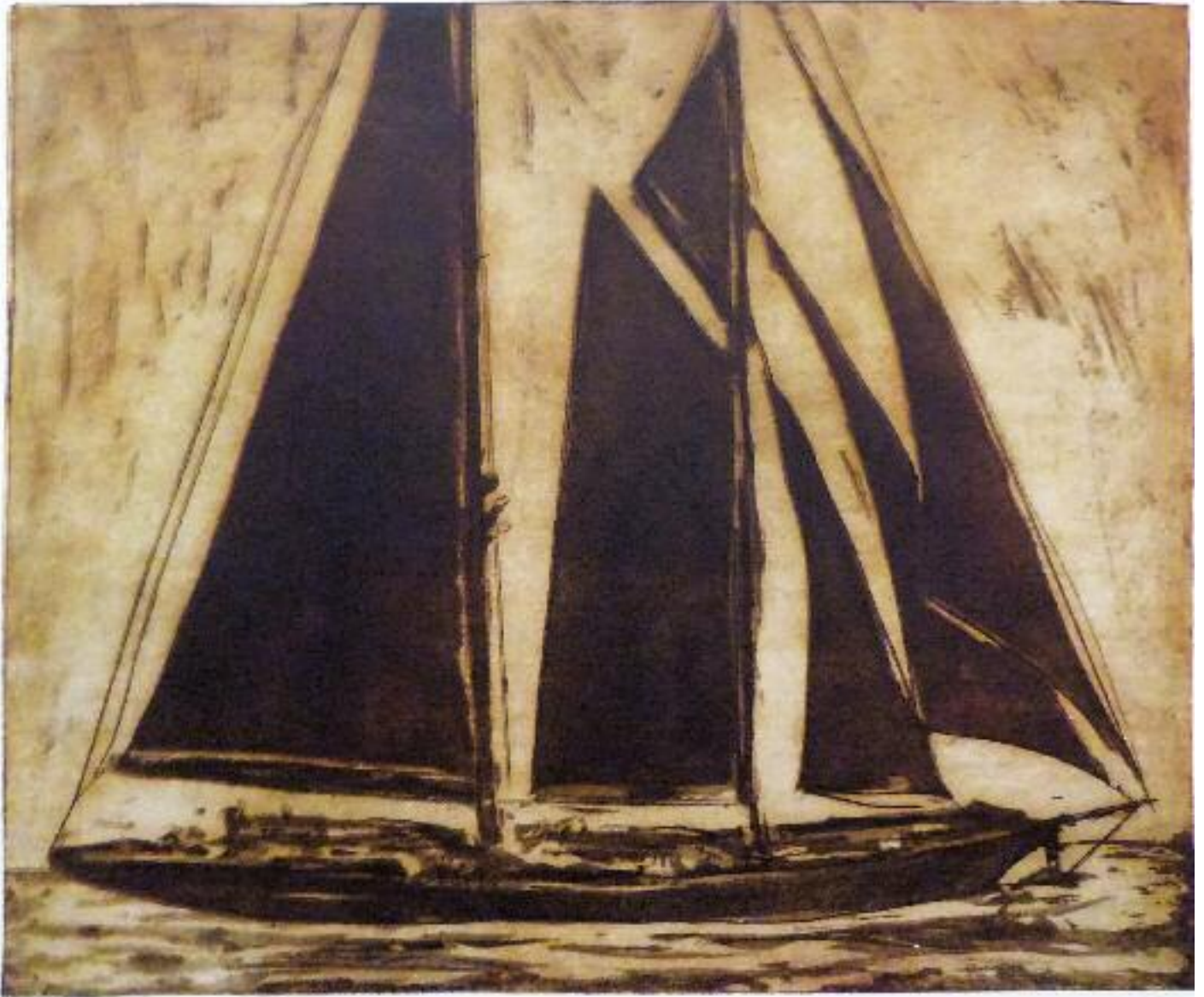
vorige Doppelseite: »Katzenfutter« Farblithographie 20 × 50 cm Auflage: 20 2006