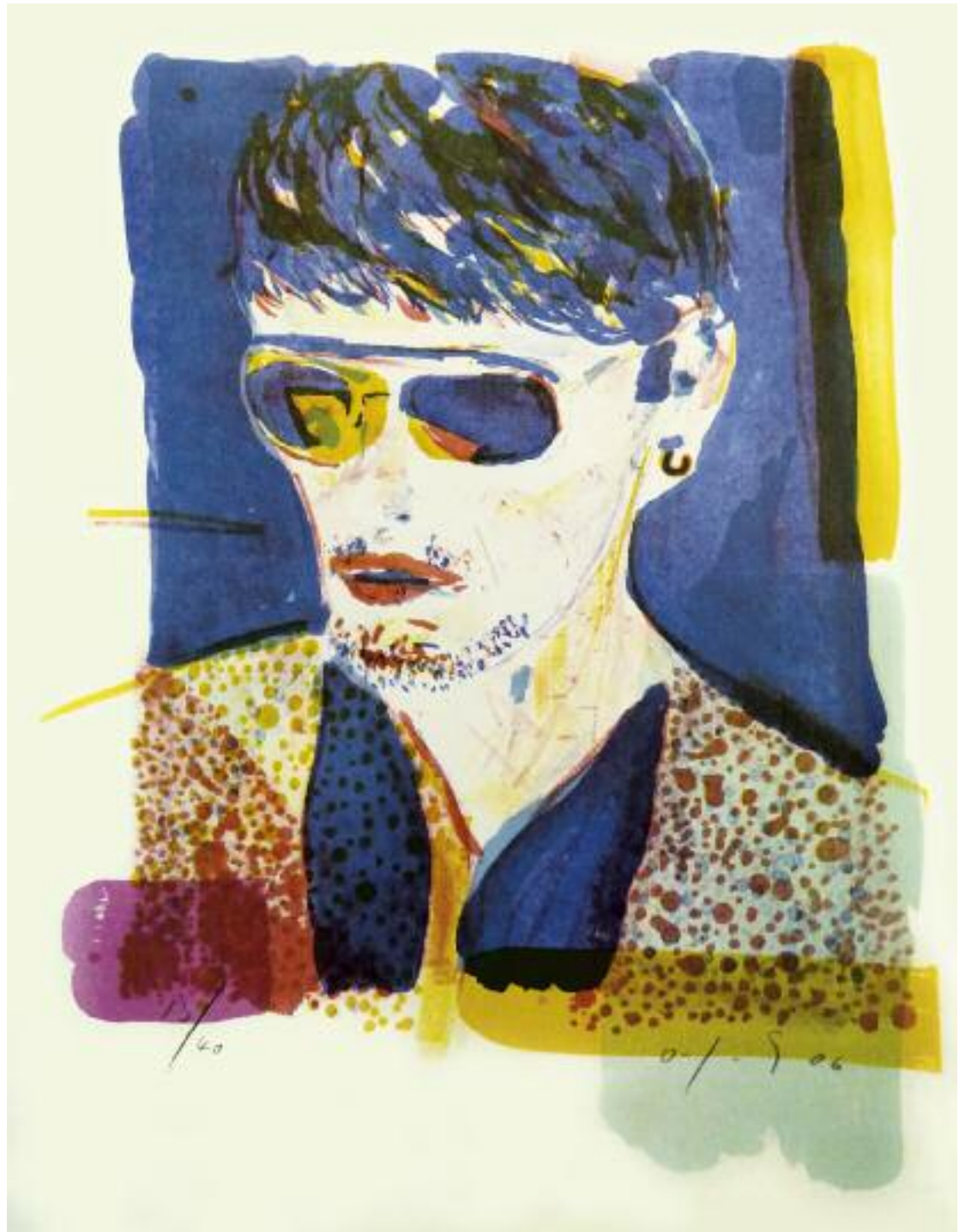
»Youth« Farblithographie Auflage: 40 40 × 30 cm 2006