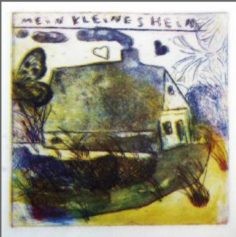
»Mein kleines Heim« Farbradierung Auflage: 20 20 × 20 cm 2018