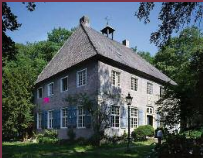
Pankok-Haus in Hünxe-Drevenack Der Pfeil zeigt auf das Overbeck-Zimmer im Pankok-Haus