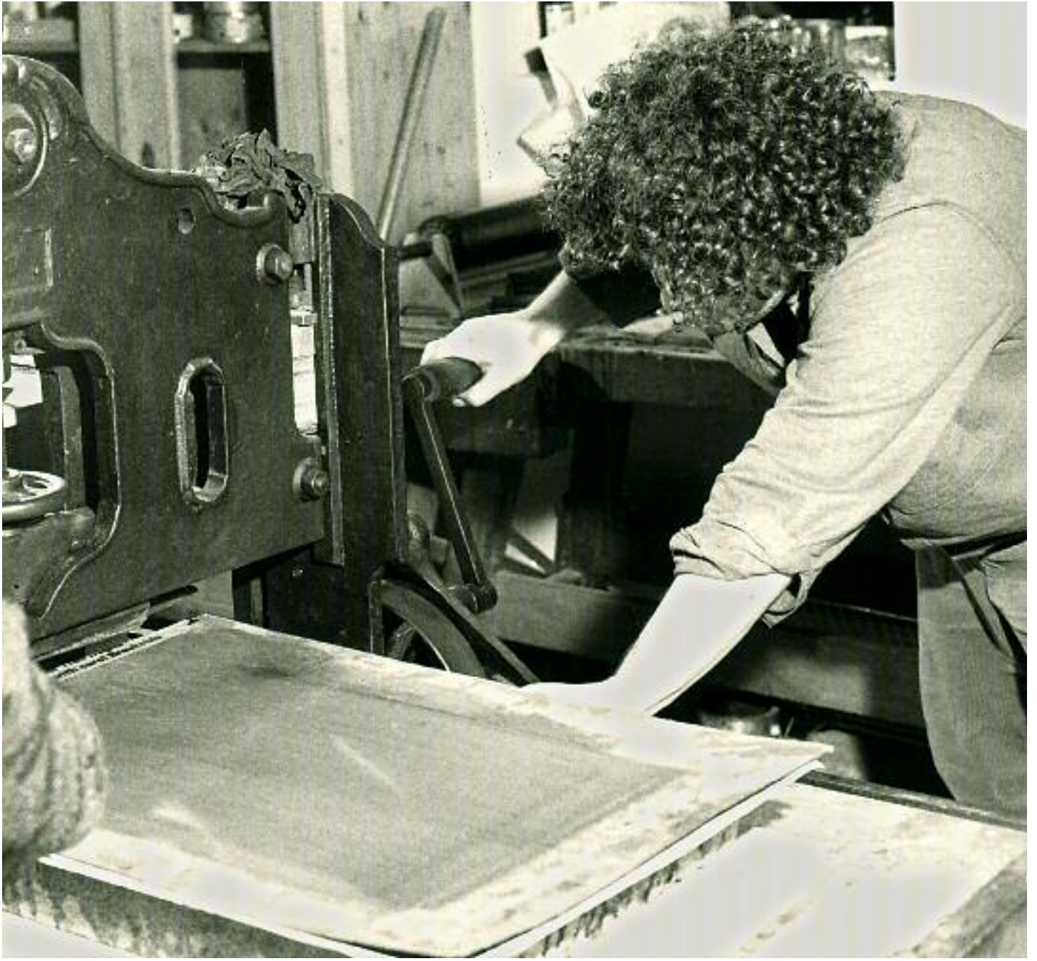
An der Lithopresse